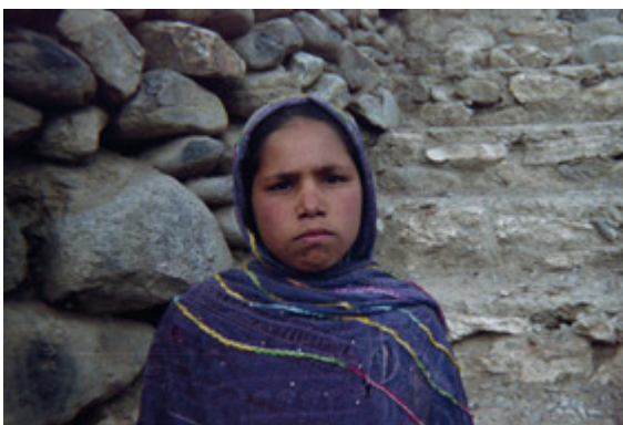
Moghul, bénéficiaire du centre d'éducation