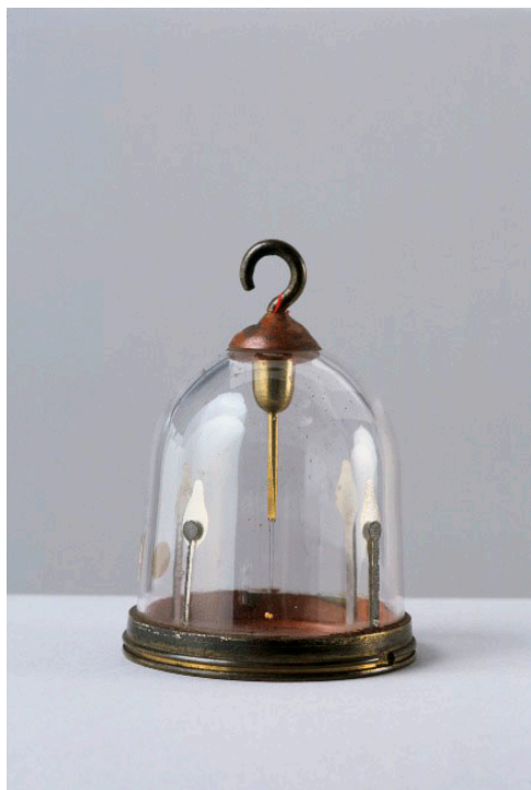
Électroscope de Saussure