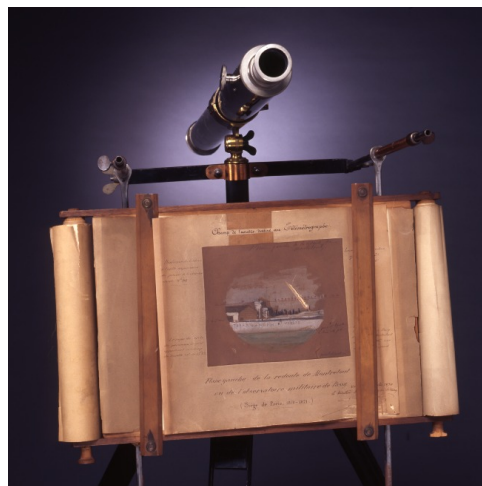
Appareil dit "Télémetrographe" employé pour les relevés de terrain et dessin 1870-1871"