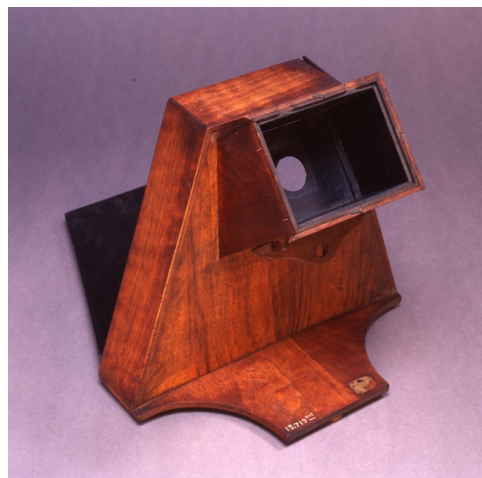
Transformateur photoplanimétrique, 1903