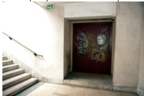
Dans l'escalier vers l'amphi Paul Painlevé