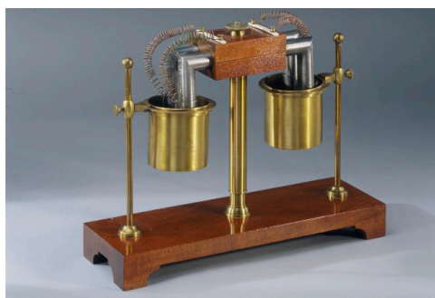
Pile thermoélectrique de Pouillet