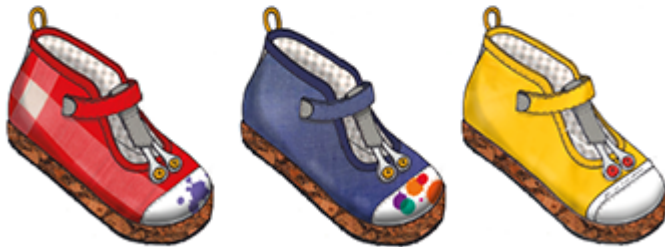
Mouchoir de Cholet, tache d'encres