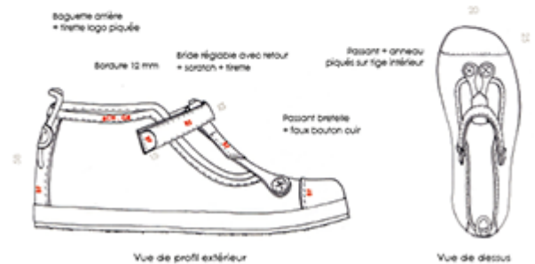
Vue de profil extérieur