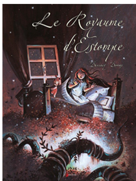
Miralda (scénario Éve Domas), Éditions La Fourmillière BD, 3 tomes