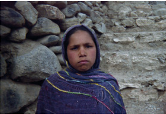
Moghul, bénéficiaire du centre d'éducation à la santé de Khoja Lakan