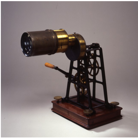
Phosphoroscope de Becquerel et objectif, 1850-1868