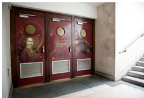
Dans l'escalier vers l'amphi.P. Painlevé