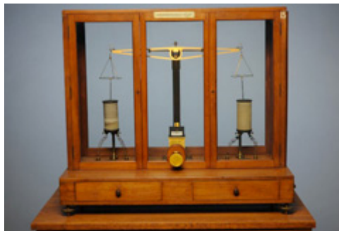
Balance électromagnétique 1820-1891