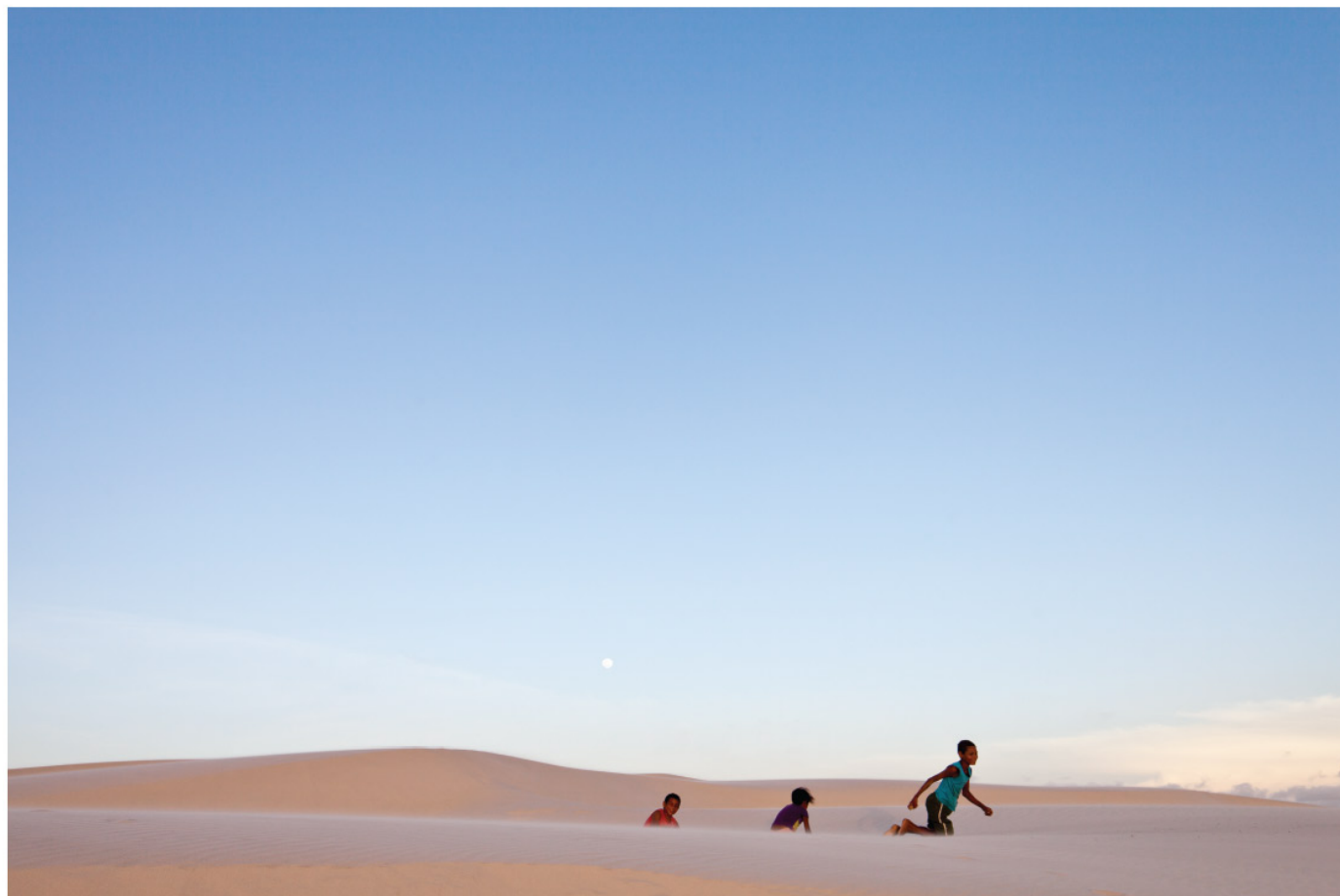
Le plus grand bac à sable du Brésil: le parc national de Lençóis de Maranhenses dans le nord-est du pays