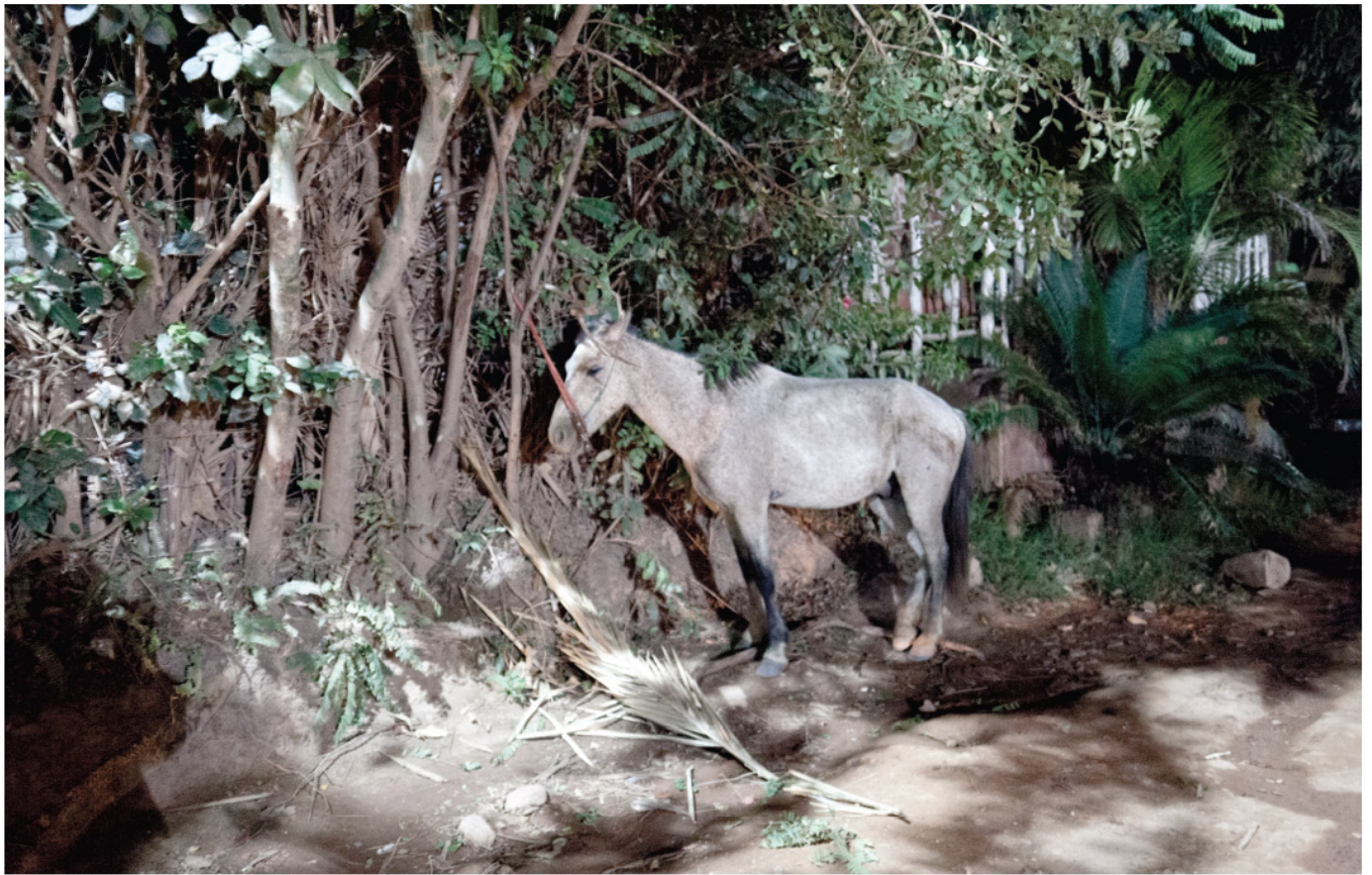
Cheval, Chapada Diamantina

Le nom fait aussi référence aux diamants, principale ressource économique des garimpeiros, ces chercheurs – d'or à la base – qui ont jadis considérablement défiguré les montagnes à coups d'explosifs. Depuis 1996, cette méthode d'extraction du diamant est interdite (70 % des ressources en diamants sont encore sous la roche, inaccessibles) et les descendants des garimpeiros se sont reconvertis en guides touristiques.