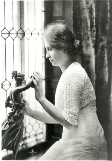
Helen Keller examinant une statue, photographie non datée

Née le 27 juin 1880, Helen Keller contracte une maladie qui la prive de la vue et de l'ouïe dès l'âge de 19 mois. Grâce à l'enseignement et le dévouement d'Annie Sullivan, Helen parvint à communiquer et interagir avec son entourage à l'aide de gestes: elle communique avec les mains en formant des lettres.