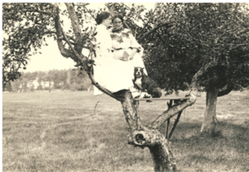
Helen Keller et Annie Sullivan assises sur un arbre, non daté.