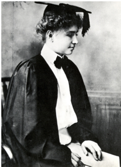
Helen Keller lors de la cérémonie de remise de diplôme à Radcliffe, 1904

Helen Keller devient, en 1904, la première personne sourde à obtenir un diplôme d'une université américaine. Auteure de nombreux ouvrages et articles, militante féministe et engagée dans la lutte contre l'handicap, elle devient une figure majeure de la société américaine avant de s'éteindre en 1968, à l'âge de 87 ans.