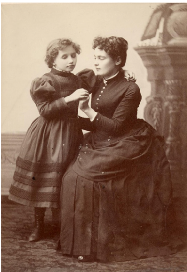
Helen Keller and Annie Sullivan, circa 1888.

A l'âge de 14 ans, Annie Sullivan fréquente l'Institut Perkins pour les aveugles et en sort diplômée, en 1886. Elle accepte, à 20 ans, le poste de préceptrice auprès de la jeune Helen Keller , sourde et aveugle. Annie gagne rapidement la confiance d'Helen en aidant l'enfant à communiquer ses pensées et ses sentiments. Annie Sullivan et Helen Keller deviennent alors des compagnes de toute une vie.