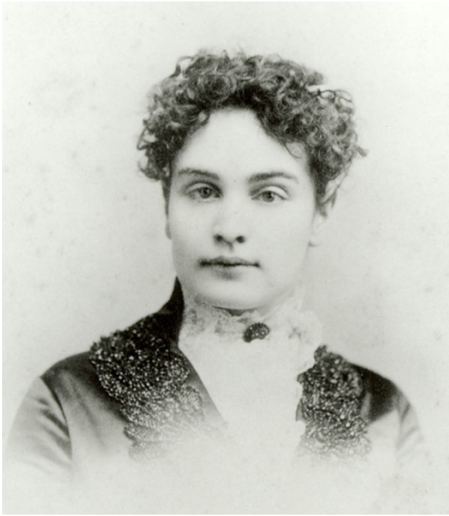
Annie Sullivan, circa 1887

A l'âge de 14 ans, Annie Sullivan fréquente l'Institut Perkins pour les aveugles et en sort diplômée, en 1886. Elle accepte, à 20 ans, le poste de préceptrice auprès de la jeune Helen Keller , sourde et aveugle. Annie gagne rapidement la confiance d'Helen en aidant l'enfant à communiquer ses pensées et ses sentiments. Annie Sullivan et Helen Keller deviennent alors des compagnes de toute une vie.