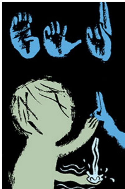
Le travail artistique