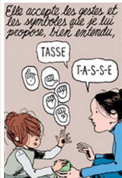
Les actions engagées contre la cécité et la surdité