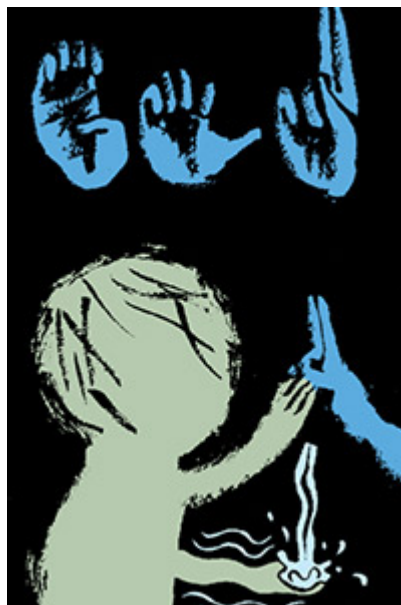
Le travail artistique