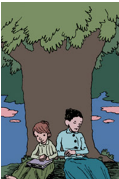
Le récit de vie

les actions engagées par le monde contre la cécité et la surdité.