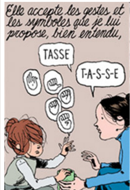
Les actions engagées contre la cécité et la surdité